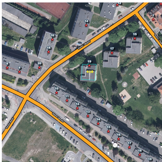
UPROSZCZONY SZKIC LOKALU MIESZKALNEGO NR 14 Bolesławiec ul. Żwirki i Wigury 19 Działka nr 418, IX obręb Instalacje: elektryczna, wodna, kanalizacyjna, gazowa poziom: III piętra p.u. 42,56m 2