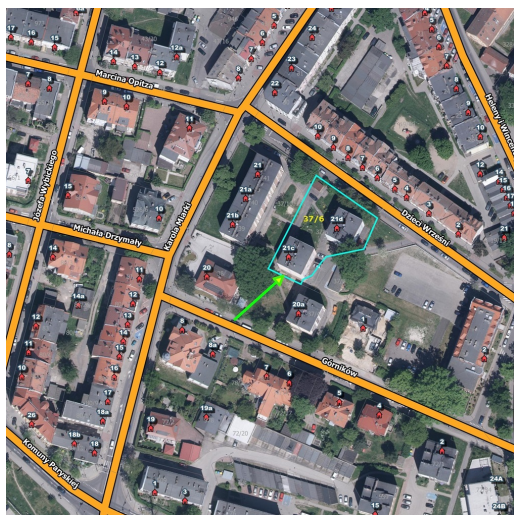
UPROSZCZONY SZKIC LOKALU MIESZKALNEGO NR 11 Bolesławiec: ul. Karola Miarki 21C nr.11 Działka nr 337/6, IX obręb Instalacje: elektryczna, wodna, kanalizacyjna, gazowa poziom II piętra p.u.: 34,66m 2