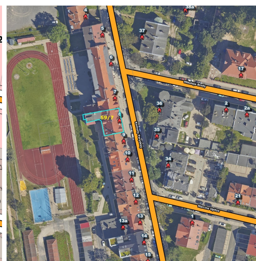
UPROSZCZONY SZKIC LOKALU MIESZKALNEGO NR 1 89-708 Bolesławiec, ul. Komuny Partyjskiej 8 działka nr 59/7, etery IX

instalacje: elektryczna, wodna, kanalizacyjna, gazowa wysokość pomieszczeń - powyżej 2,20m; powierzchnia użytkowa - 82,92m 2